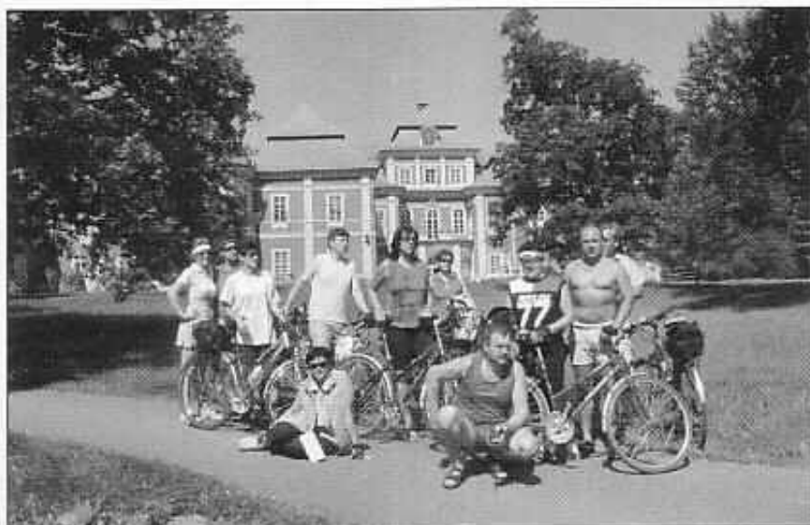
Cyklovýlet jižní čechy

5. – 8. 8. Čtyřdenního pobytu na Písecku se zúčastnilo 12 příznivců cykloturistiky. první den navštívili město Písek