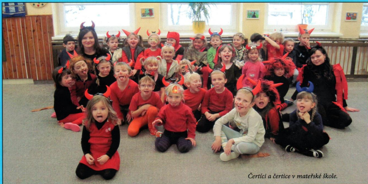
Čertíci a čertice v mateřské škole.

Vydává obec Podolí ©2010. Redakční rada (telefon: 608705635)