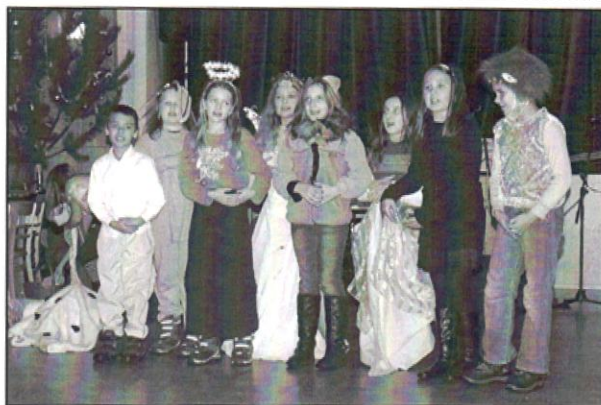
Vystoupení dětí na besedě s důchodci.