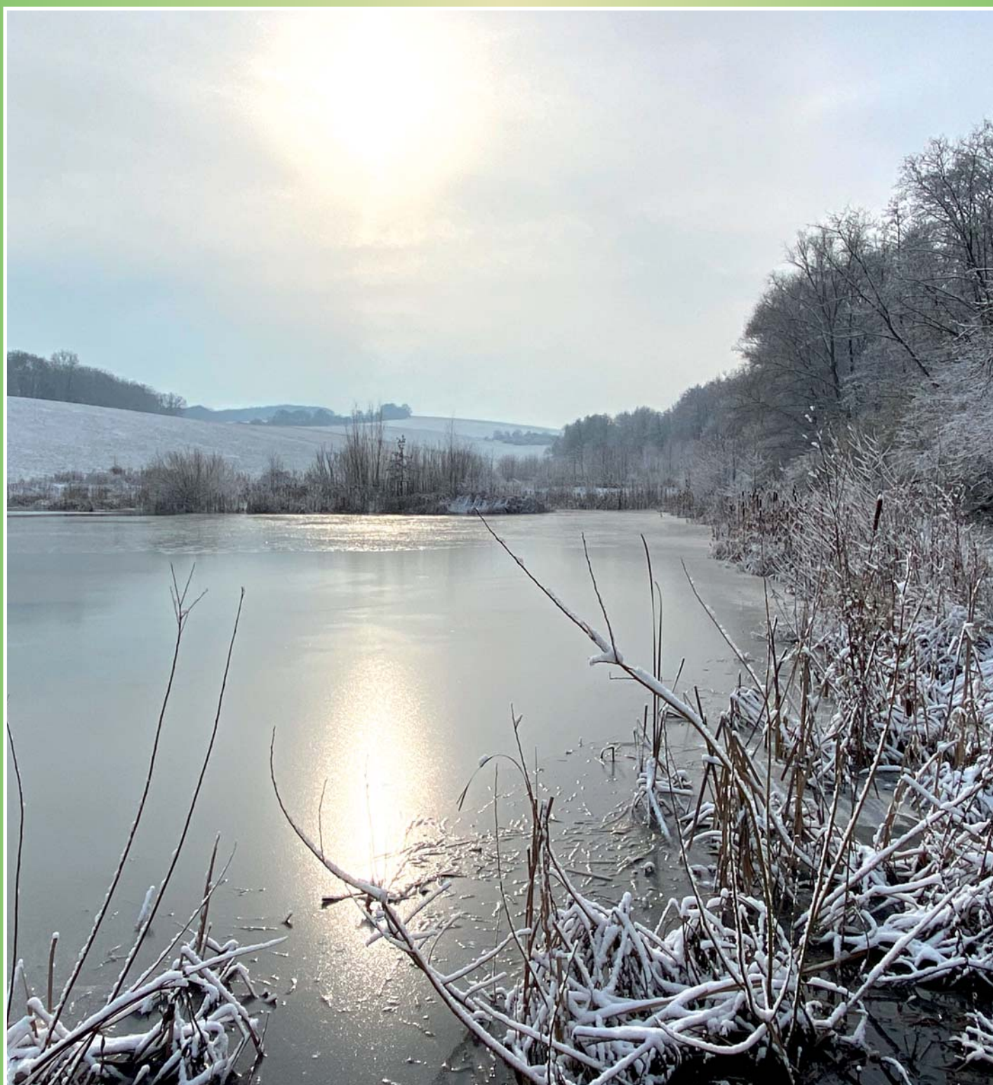
Podolské mokřady v zimě