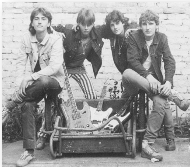
S károu, na které jsme pořád převáželi naši aparaturu tam a zpět.