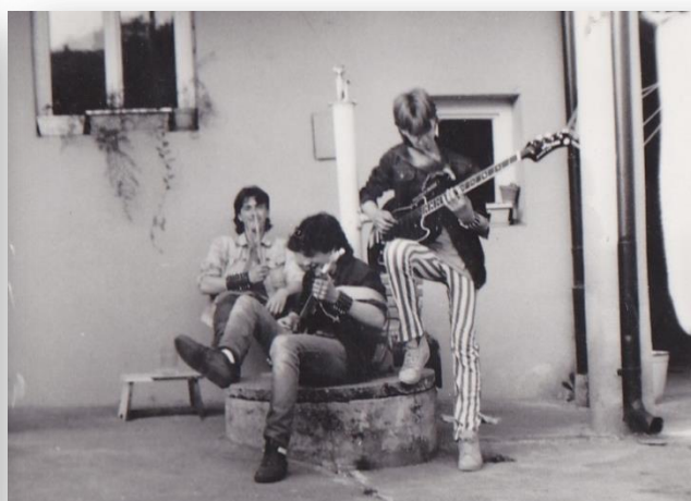
Monster u Kryštofů.