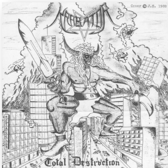
Alternativní, nikdy nepoužitý obal druhé demonahrávky Krabator z října 1988.