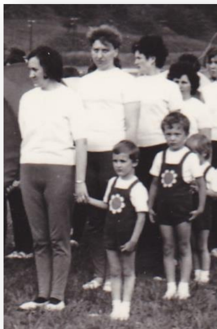
Spartakiáda na podolském fotbalovém hřišti (1975).