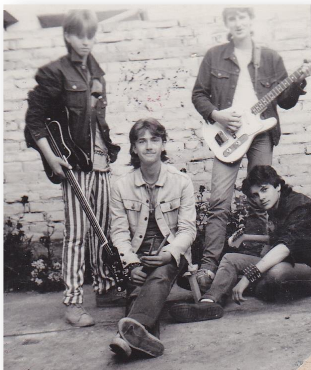
První sestava KRABATOR – éra Podolí.