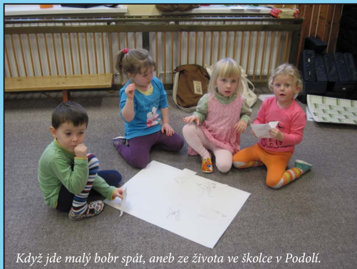
Když jde malý bobr spát, aneb ze života ve školce v Podolí.