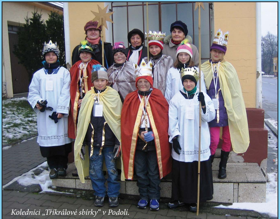
Koledníci „Tříkrálové sbírky“ v Podolí.