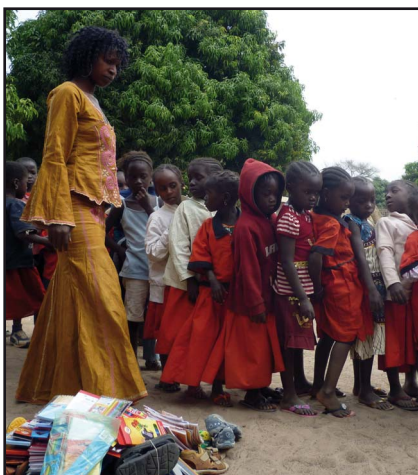
Dárky z Podolí dorazily do Gambie