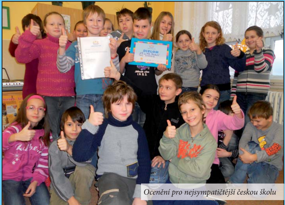
Ocenění pro nejsympatičtější českou školu