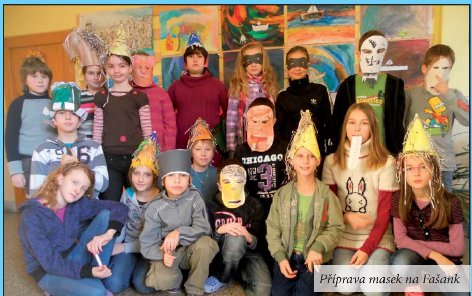
Příprava masek na Fašank