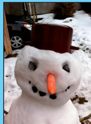
Strážce zimy pan Sněhulák