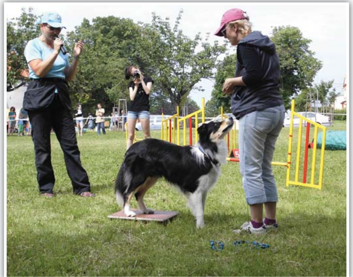
Ukázka nácviku nástupu na target na Bílokarpatských slavnostech v Uherském Brodě