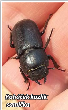
Roháček kozlík samice