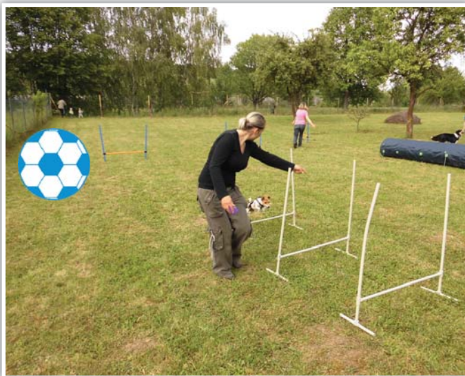
Sekvence tří překážek