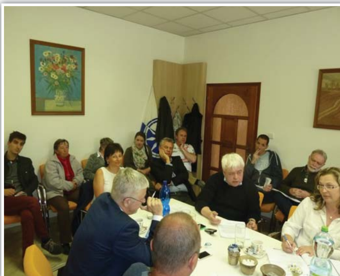
16. veřejné zasedání zastupitelstva