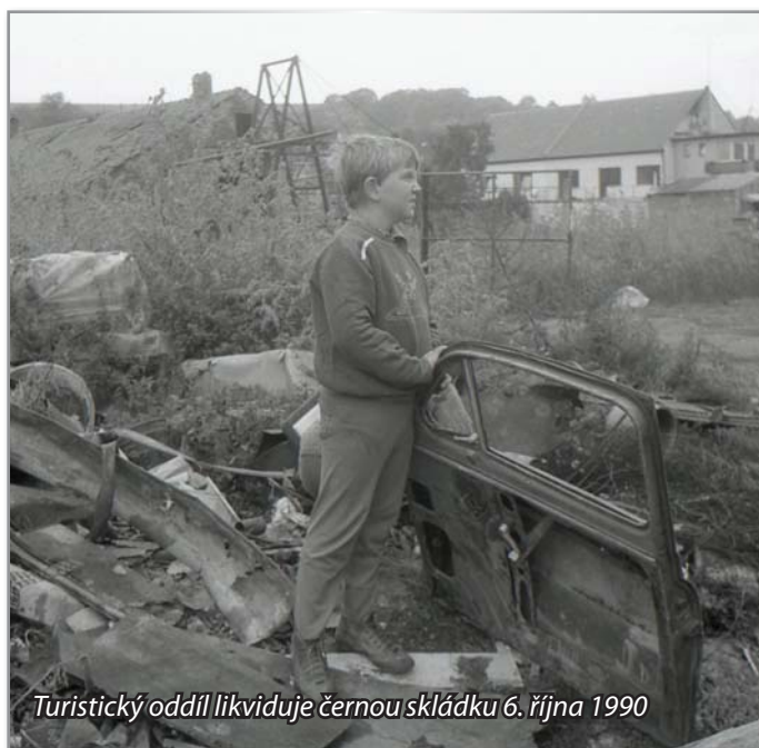
Turistický oddíl likviduje černou skládku 6. října 1990