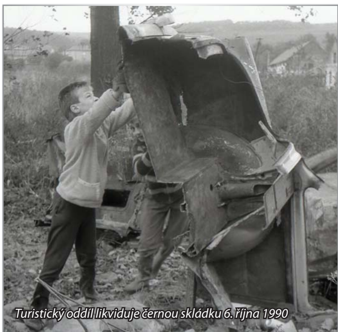
Turistický oddíl likviduje černou skládku 6. října 1990

Klasická víčka od zavařovaček, která jsou zpravidla potažena nějakou gumou, nelze vytrít nikam. Pod gumou je většinou hliník nebo jiný kov, ten třít lze, potažený gumou patří ale do smíšeného odpadu. Samotnou gumu také nelze nikam vytrít. Pokud jsou víčka pouze kovová, lze je vytrít do kovů, které odebírá téměř každý sběrný dvůr.