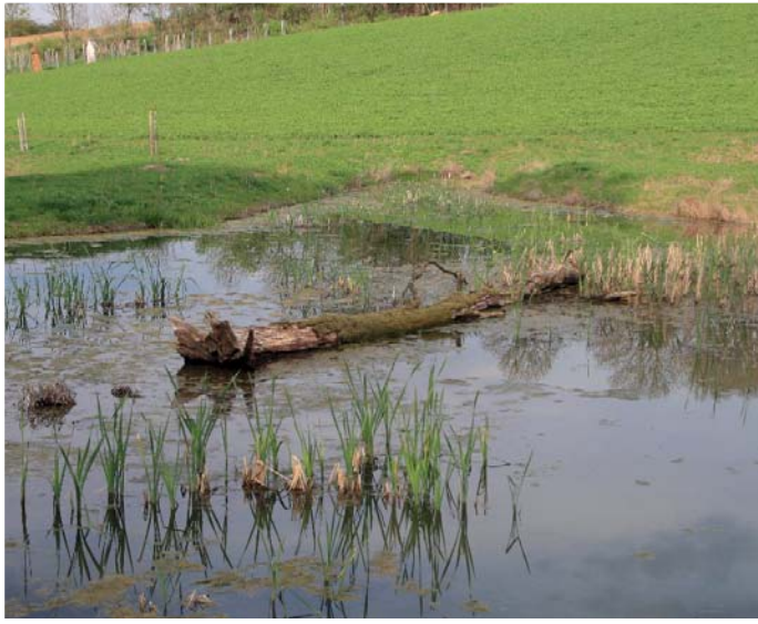
Kmen dubu ve vodní ploše je vítaným útočištěm pro mokřadní živočichy. Vodní rostliny už dříve zakořenily a teď už se jen budou rozrůstat.