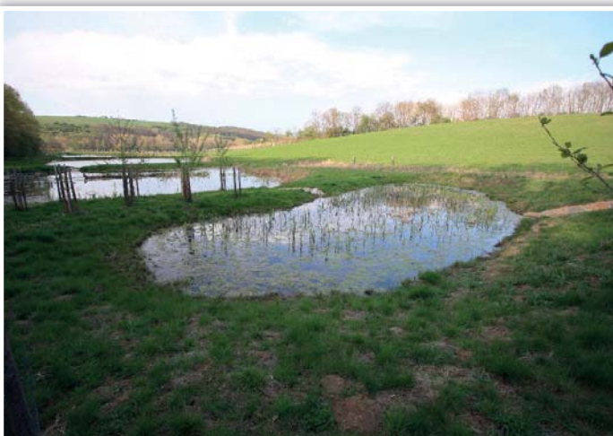
Plné mokřadní nádrže uchovávají vodu ze sněhové pokrývky na horší časy.