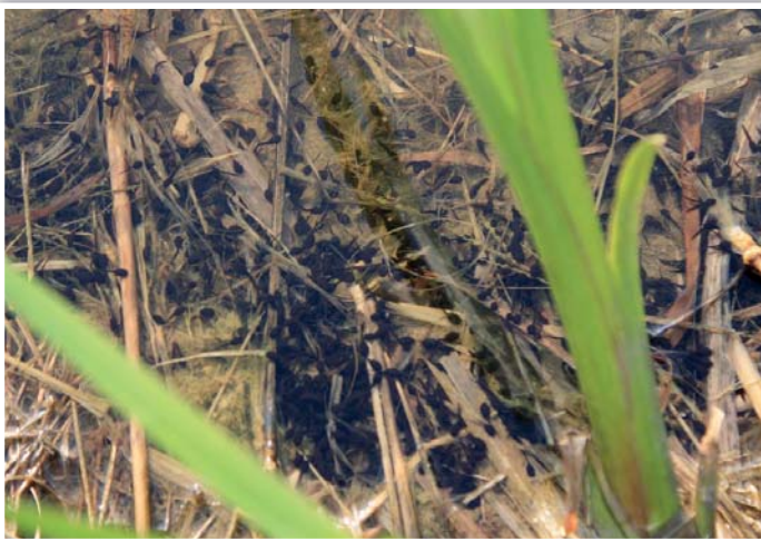
Pulci už obsadili svá rodiště. V tisících pulzují mokřadními nádržemi a tůněmi.