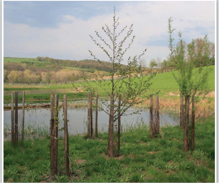
Svěží zelená barva na pučících stromcích se za pár dnů rozvine do košatých mladých korun.