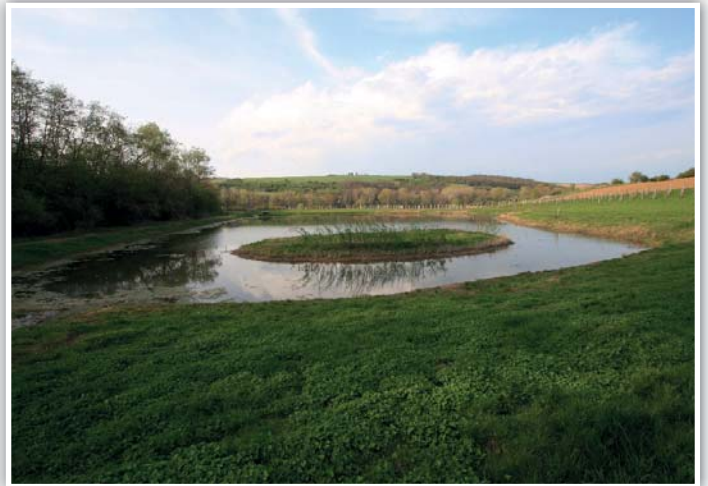
Ostrůvek je bezpečným domovem i příležitostným odpočívadlem vodním ptákům.