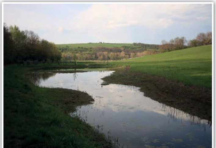
Mokřad s nezvykle velkým úbytkem vody. Chytré hlavy už zjišťují příčinu.