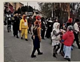
Masopustní průvod mask. Podolí 2. 3. 2019.

Během roku se chodily hrát šanderle . Nositelům jména, které se hojně v obci vyskytovalo, jako Anna, Josef, Antonín a podobně, se chodilo v předvečer jejich svátku vyhrávat. Obvykle dechovka zahrála před domem nějakou oblíbenou písničku, a kdo neuměl na nic hrát, tloukl na lžičky a pokličky skřídle k hrncům. Zvyk zanikl v obci na počátku 60. let 20. století. 263