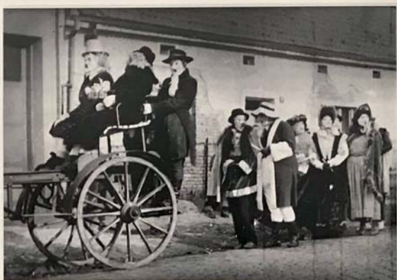
Masopustní průvod. Podolí, sedesátá léta 20. století. (SM UH)