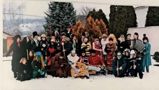
První ročník obnově faňankové občičky Podolí 1. 3. 2004.