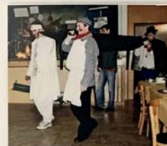
Pochovávací hry na faňankové zábavě. Podolí 9. 2. 2005.