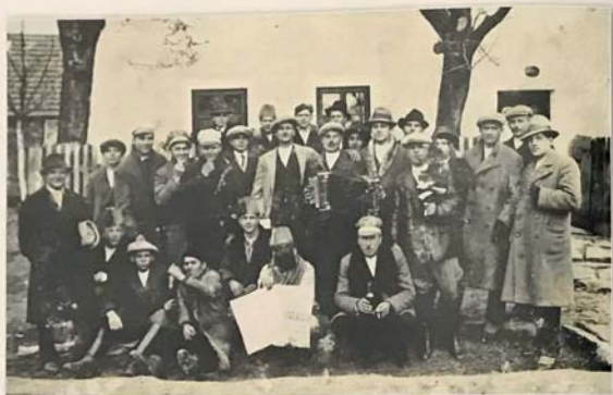
Faňank v Podolí; třicátá léta 20. století.