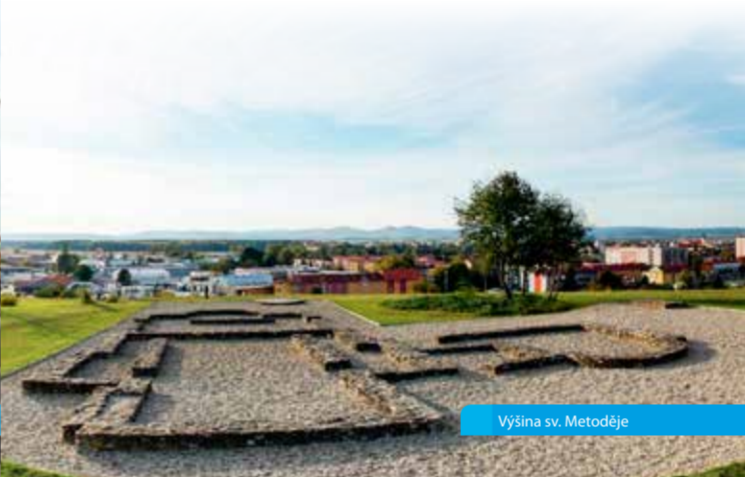
Výšina sv. Metoděje