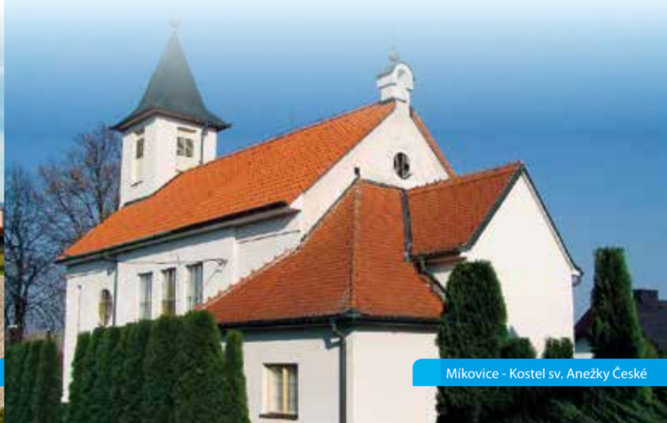
Mikovice – Kostel sv. Anežky České