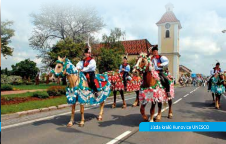
Jízda králů Kunovice UNESCO