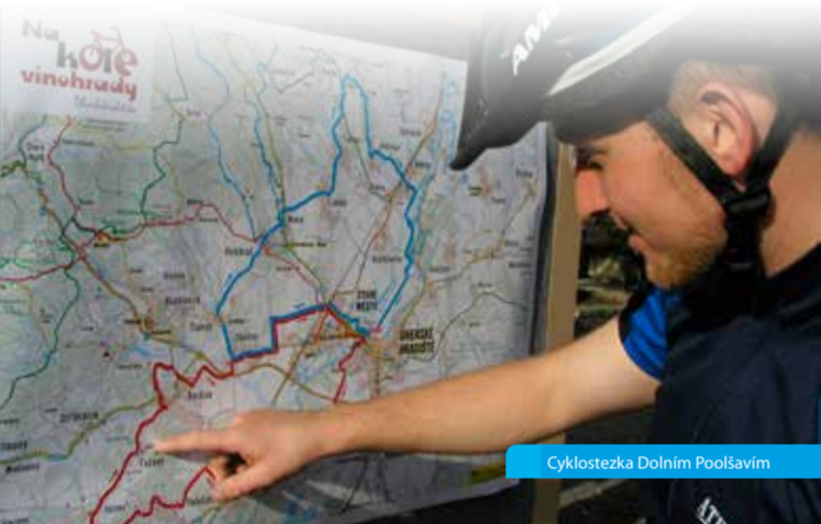
Cyklostezka Dolním Poolšavím